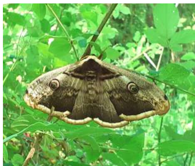
Grand Paon, de 15 cm d'envergure près du Ventadou