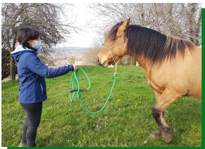
Edwige BEX et son cheval Enia

( https://www.facebook.com/groups/880249082827083/about )