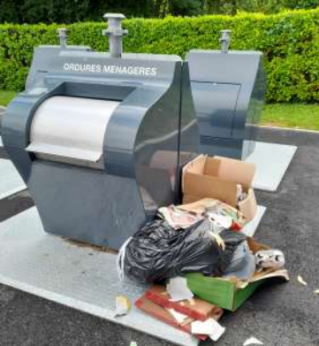
Détritus aux pieds des bornes enterrées