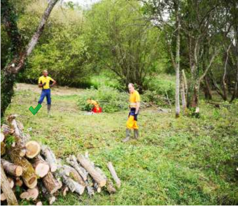
Nettoyage de la zone humide par les agents communaux