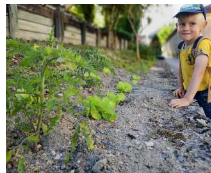
Potager de la rue des Cailloux devant la mairie – Penser à m'arroser...

Les professeurs des écoles Mme Jaffrain, et Mme Laforgue ont organisé des séances de jardinage. Suite à leur demande, les employés municipaux ont confectionné des bacs en bois pour la cour de récréation et ont préparé la terre devant la mairie. Les plus petits ont planté des plantes aromatiques et les plus grands des plants de tomates, de salades et des fraisières dont il faudra prendre soin durant l'été. Si vous passez rue des Cailloux munissez-vous d'une bouteille d'eau pour arroser ces plantations afin que les enfants continuent d'en profiter à la rentrée