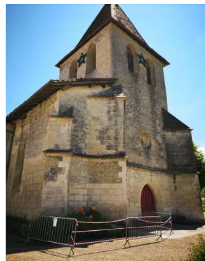
Des barrières sont placées pour sécuriser le parvis

Dans le cadre du plan de relance de la culture, des crédits de l'état à hauteur de 7000 euros ont été alloués pour financer la rénovation de la toiture du presbytère. Il reste encore des études à réaliser afin de sécuriser l'ensemble de l'édifice.