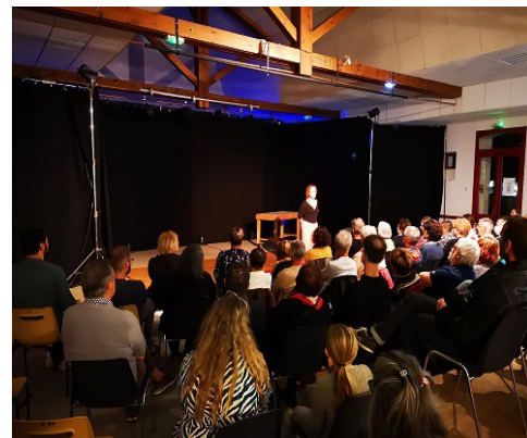
15 octobre 2022 représentation de "Palace" avec l'Atelier Rouge Théâtre