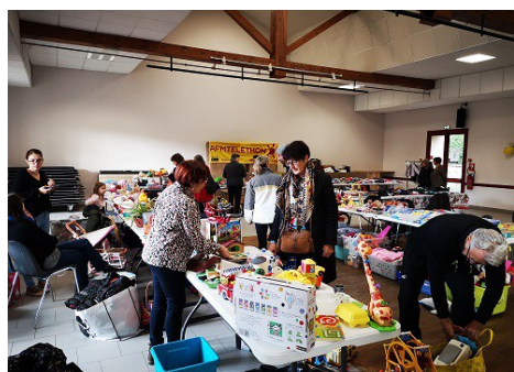
Décembre 2022 Bourse aux jouets du Téléthon - Comité des fêtes et Cercle des fées mères