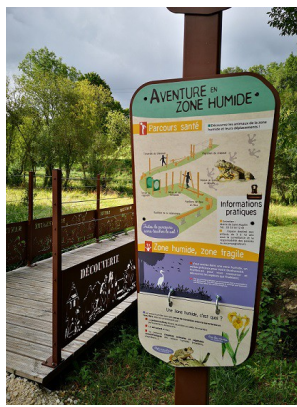
Signalétique du parcours