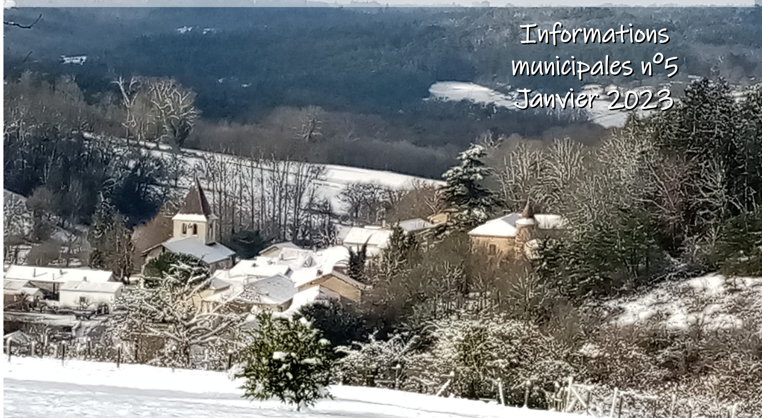
Bourg de Saint-Aquilin sous la neige, janvier 2023

Informations municipales n°5 Janvier 2023