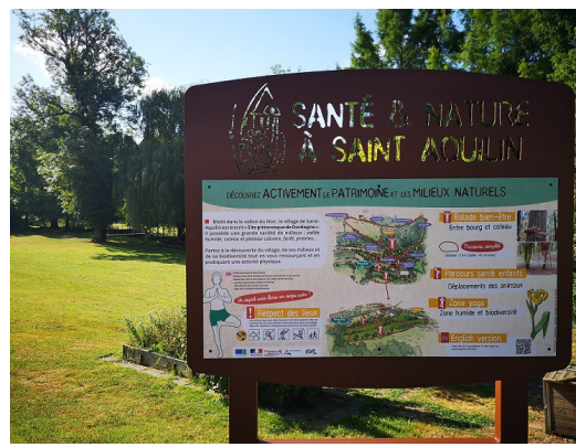
Panneau d'accueil du parcours, parking cantine