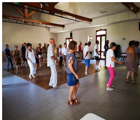
Juillet et août 2022 cours de danse gratuit - Cercle des fées mères