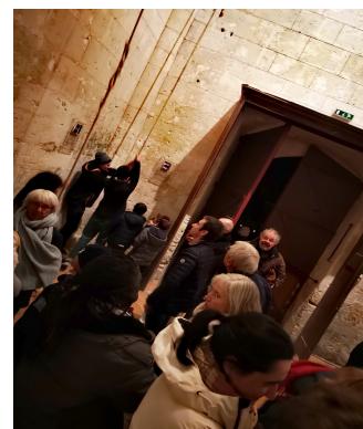
Du 13 au 24 décembre Sonnaillies – Les Amis de St Aquilin