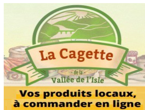
Tous les vendredis de 18h à 19h La cagette au Fournil – Mairie et Isle&Co