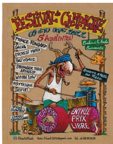
9 et 10 septembre 2022 Festival de Campagne - Fil Vert