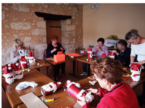
Novembre 2022 atelier déco de Noël - Mairie et Comité des fêtes