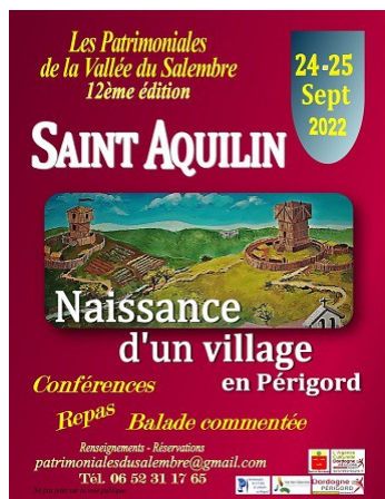
24 et 25 septembre 2022 Les patrimoniales à St Aquilin