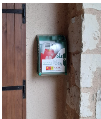
Défibrillateur de St Aquilin