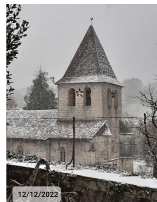
Église décembre 2022

Une étude est en cours pour établir un premier état des lieux ; L'architecte a été choisi lors du dernier conseil municipal, pour établir les priorités.