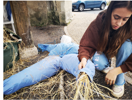
L'atelier créations des épouvantails du CMJ le 31 octobre 2022 dans le bourg