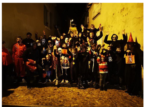
31 octobre 2022 Halloween - CMJ et Cercle des fées mères