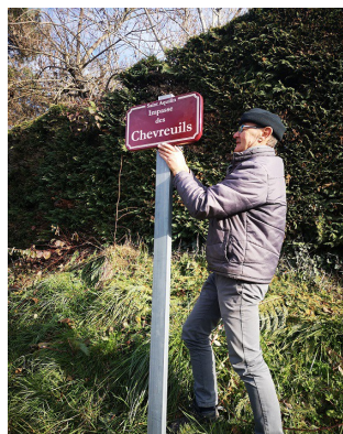
Pose de panneaux de rue