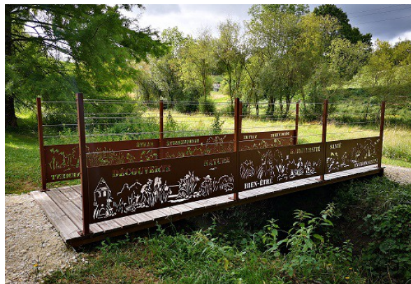
Passerelle départ parcours Santé et Biodiversité, pré de l'église