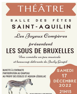
17 décembre "Les sous de Bruxelles" avec Les Joyeux Compères