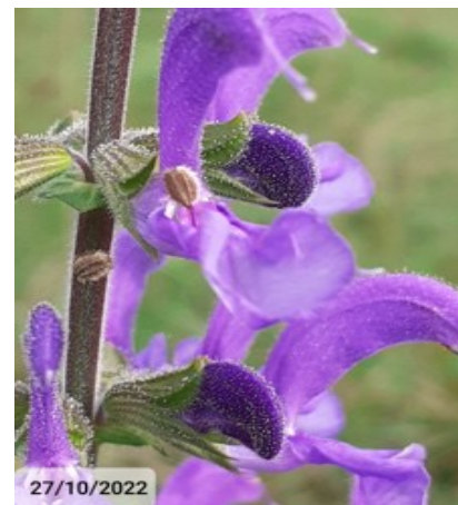
Sauge des prés, Vigerie Haute

Le projet porté par la commune aux côtés du SMDI (Syndicat Mixte du Bassin de l'Isle) et de l'association "Les enfants du Pays de Beleyrne" (structure rurale d'éducation à l'environnement) vise à connaître la biodiversité présente sur le territoire et à sensibiliser les citoyens, les acteurs sociaux-économiques et les élus à la biodiversité. À l'occasion de la journée du Patrimoine 2022, des ateliers intitulés "Jardiner sans pesticides", "Malle Rivière", "7eme continent" et "Libellules" ont permis aux participants de découvrir les enjeux de la biodiversité et du développement durable. Des inventaires ciblés seront établis par des professionnels et diverses manifestations auprès des habitants seront proposées. À l'étude également, la création d'une photothèque de la biodiversité de Saint-Aquilin basée sur les photos prises par chacun d'entre nous !