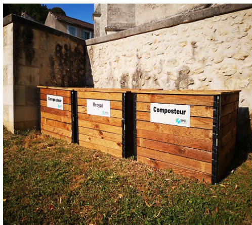
Composteurs collectifs