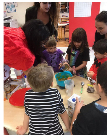
Halloween à l'école de St Aquilin