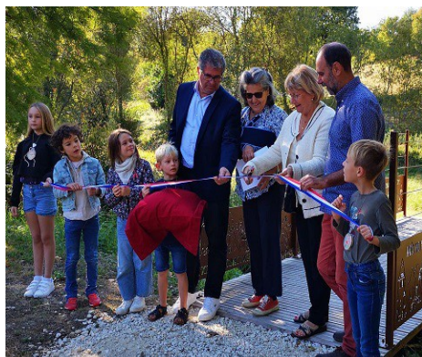
18 septembre 2022 inauguration du Parcours Santé et Biodiversité - Mairie